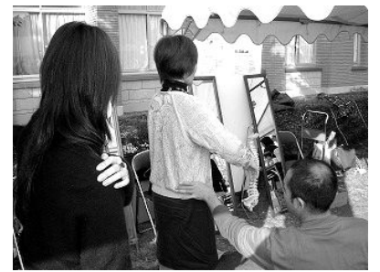
スタッフは ICU 卒業生ボランティア 姿勢チェック@本館前テント