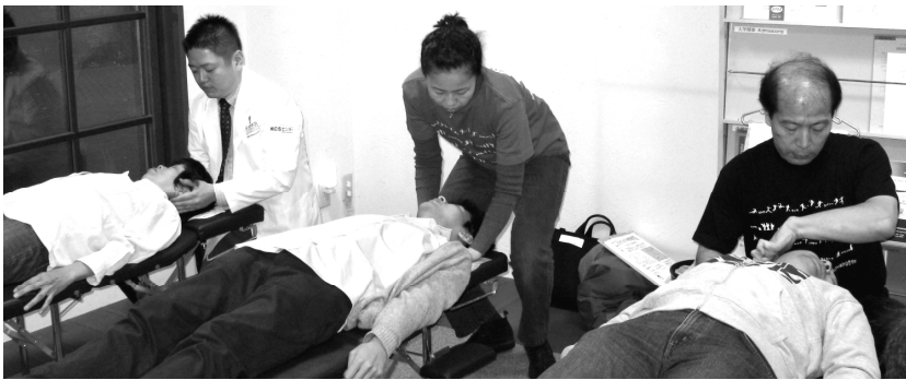
WHO 国際基準カイロプラクターによる体験施術

ICU 祭は今年で 50 回目、佃のカイロプラクティック健康教室 & 姿勢チェックでの参加は今年で 8 年目です。今年も ICU 同窓生及び当院のボランティアスタッフの協力を借りて ICU 祭に参加させていただきます！！